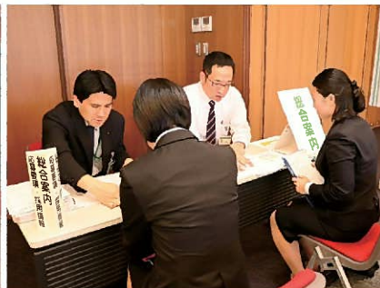
応募要項・採用試験に関する説明