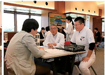
各職種・部署相談