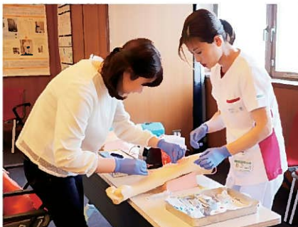
専門職体験コーナー