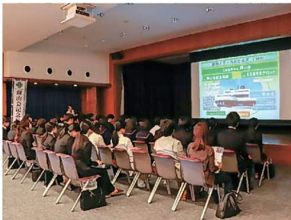
法人グループ概要説明