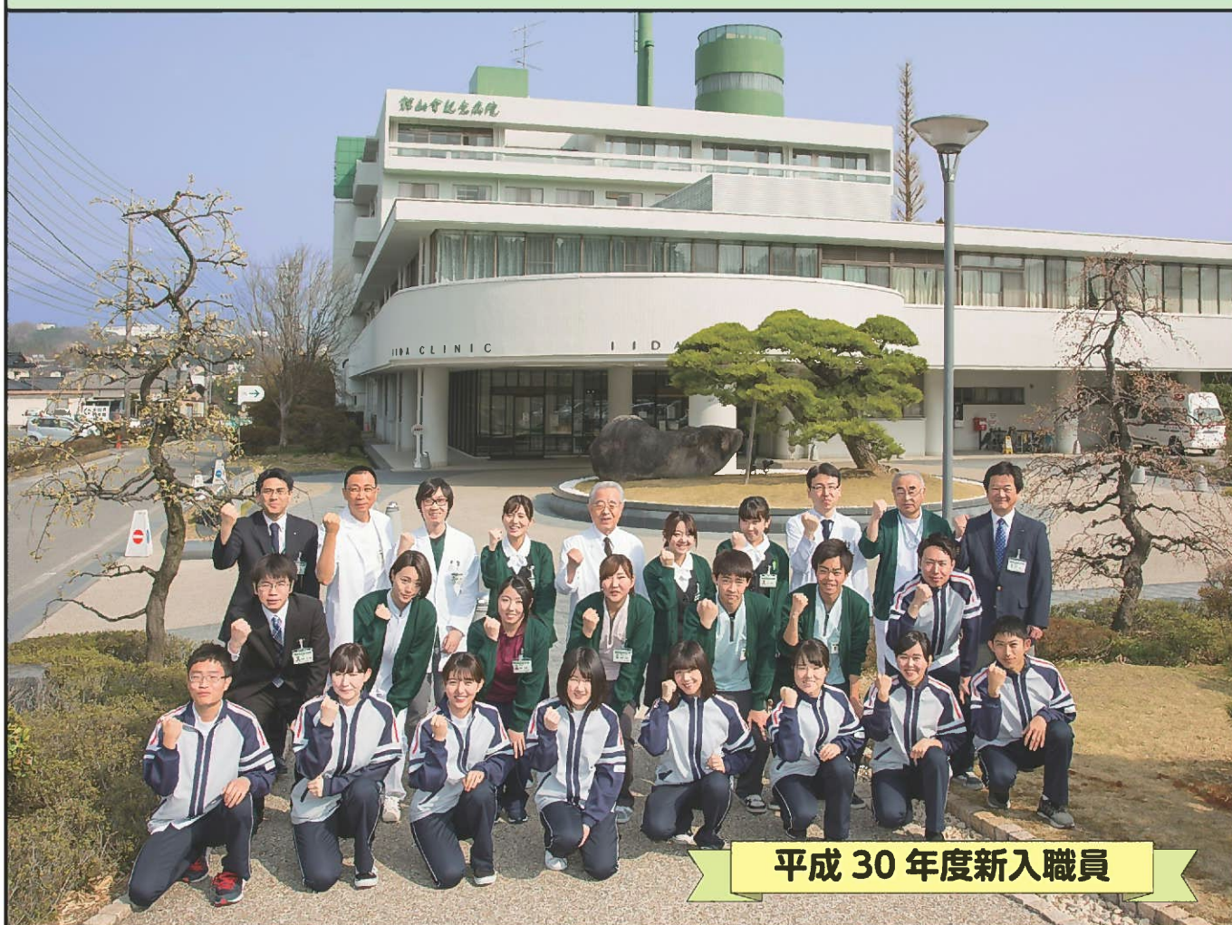
平成30年度新入職員