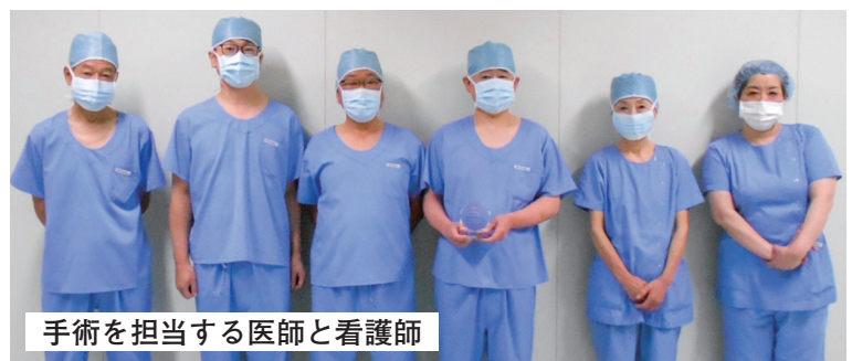
手術を担当する医師と看護師

大銀杏の発売20周年に合わせ、累計1,000本以上使用した全国36施設に楯が贈られたそうです。