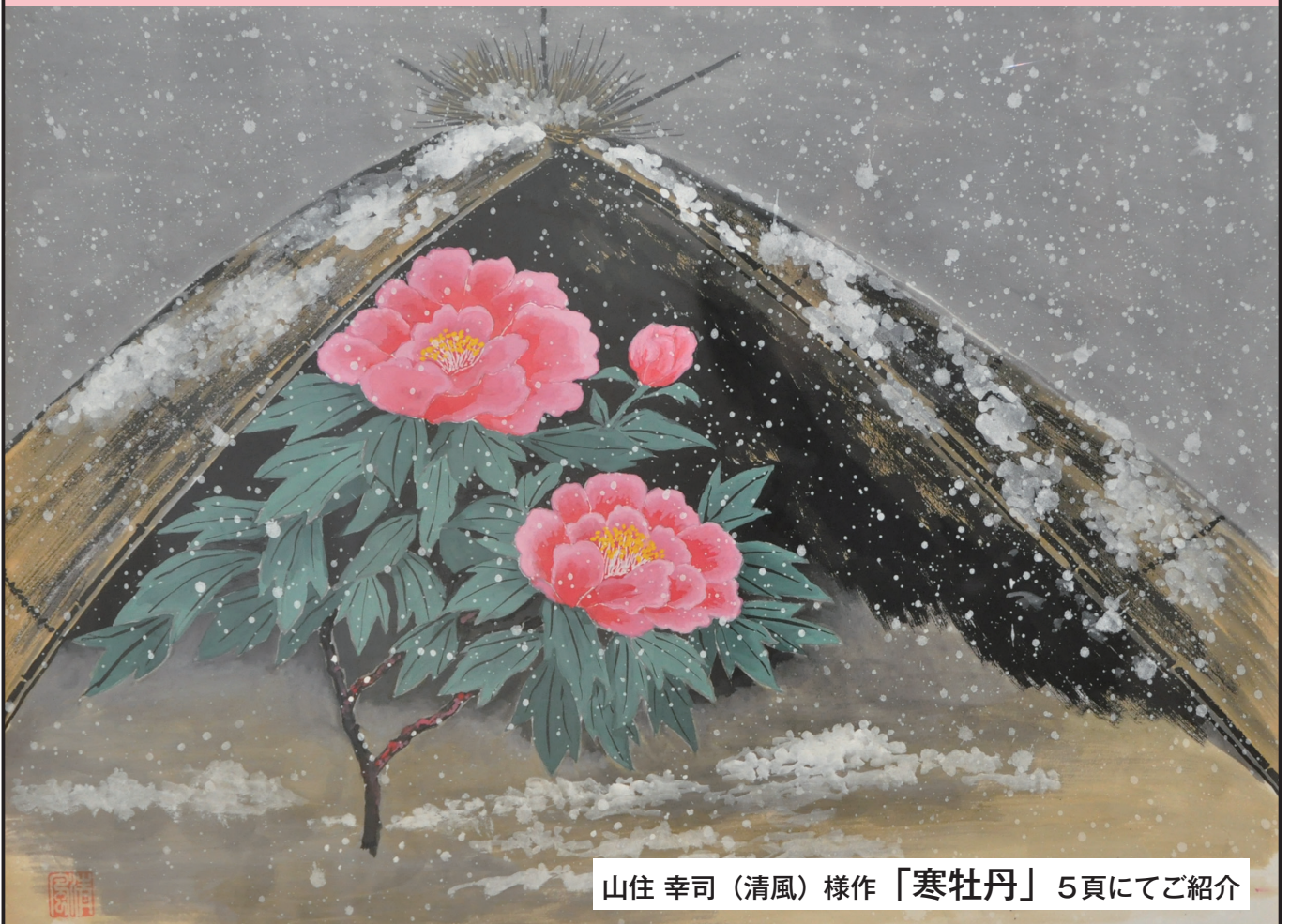
山住 幸司 (清風) 様作「寒牡丹」5頁にてご紹介