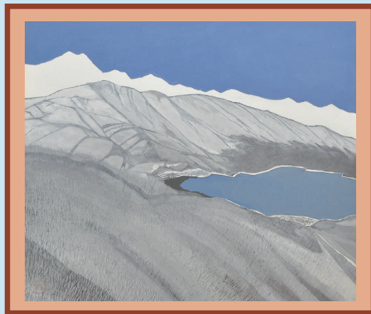
後立山連峰と青木湖