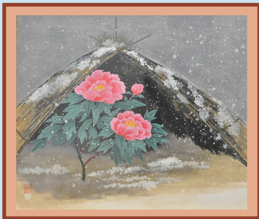
寒 牡 丹