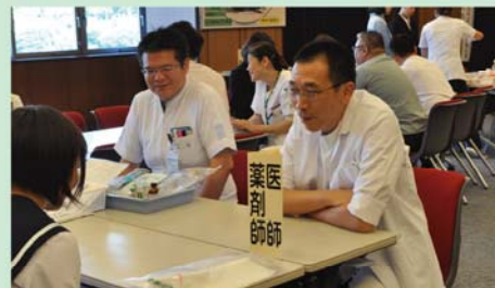
各職種・部署相談