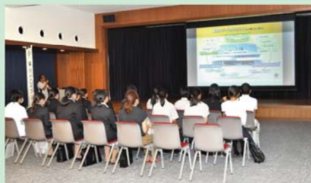
法人グループ概要説明