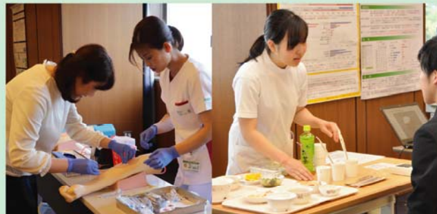
専門職体験コーナー