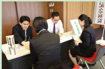
応募要項・採用試験説明